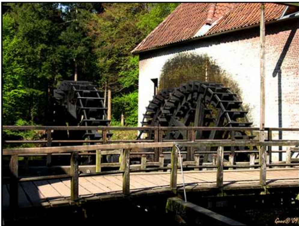
Foto: watermolen Singraven

Bron: Nederlands Watermuseum Infoblad Nederlands Watermuseum 2009