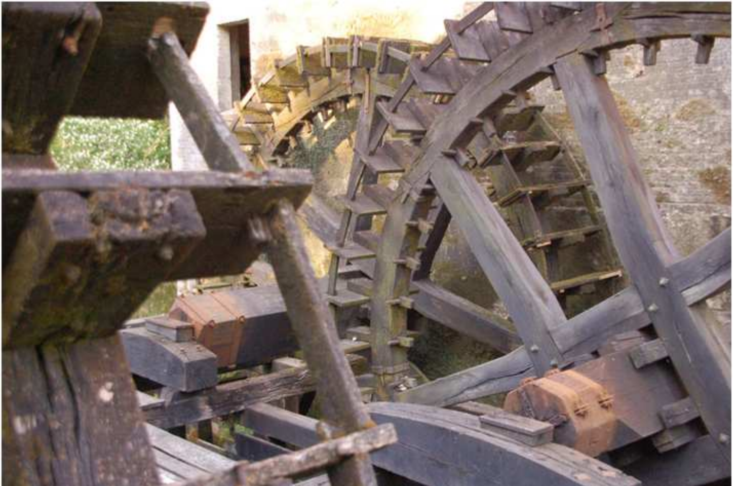
Het schoepenrad van watermolen "Singraven"