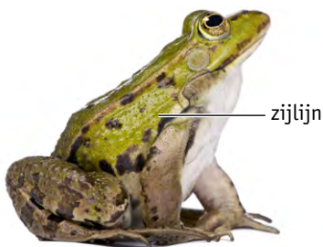
2 bij een kikker