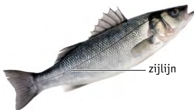
1 bij een vis